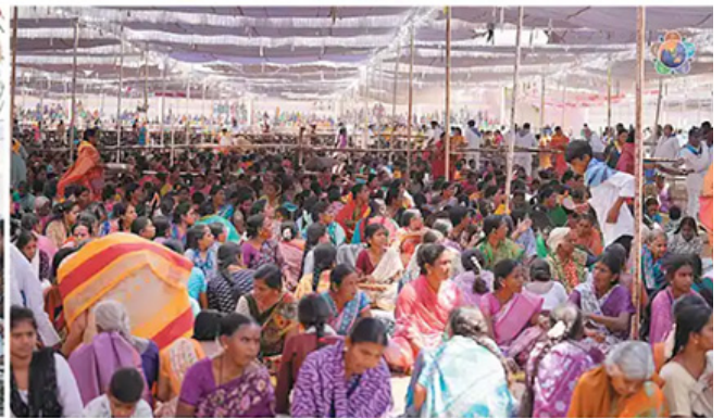
Devotees singing Sai Pancharatna Kritis