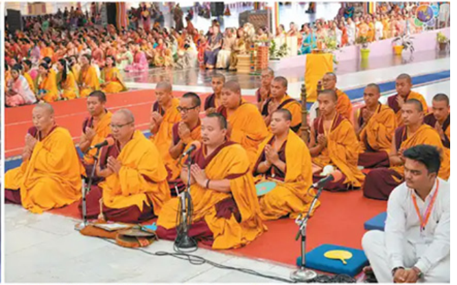
Buddha Purnima Celebrations (Report will be published in the next issue)