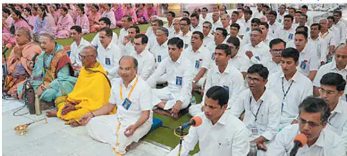
Ekadasa Rudra Parayanam (Report will be published in the next issue)