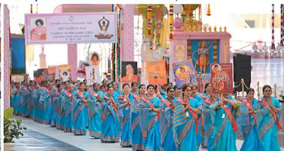
Procession of participants – Sri Sathya Sai Vahini Sudhamrutha Certification Course