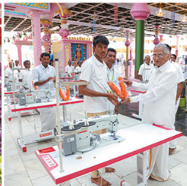
Distribution of Sewing Machines.