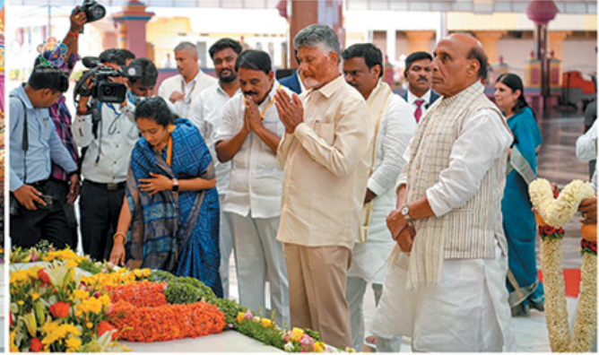
Hon'ble Defence Minister of India Sri. Rajnath Singh, Hon'ble Chief Minister of Andhra Pradesh Sri. Nara Chandrababu Naidu and other dignitaries offering obeisance at the Divya Sannidhi.