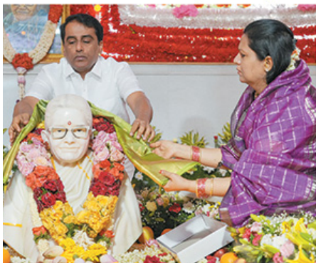
Tributes to Mother Easwamma.