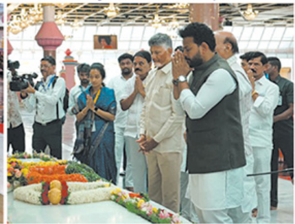
Dignitaries paying floral tributes at the Divya Sannidhi.